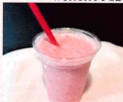
いちごのスムージー ¥500