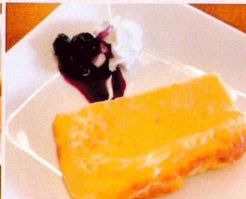
手作りチーズケーキ ¥350