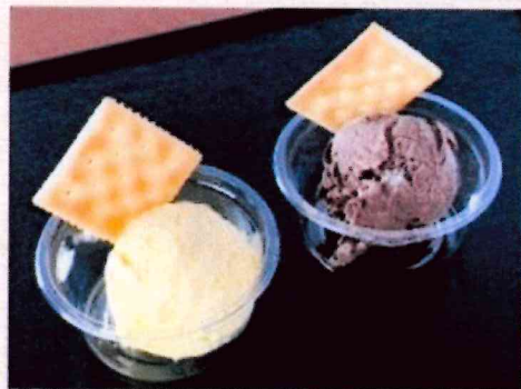
アイスクリーム バニラ or チョコ ¥200