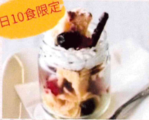
ワッフルとベリーの トライフル ¥300