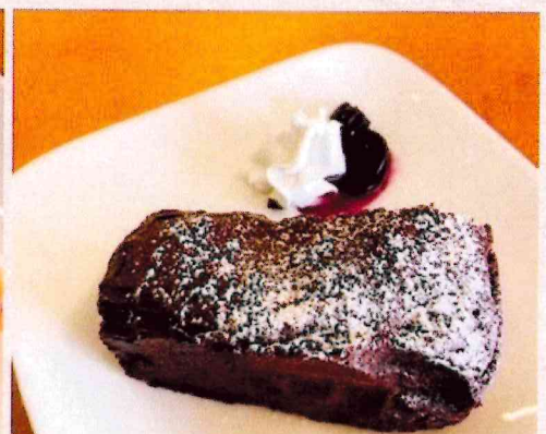
手作り チョコレートケーキ ¥350